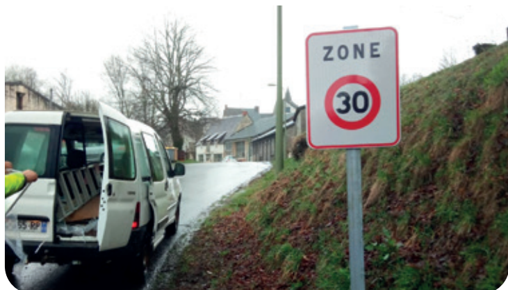
La zone 30