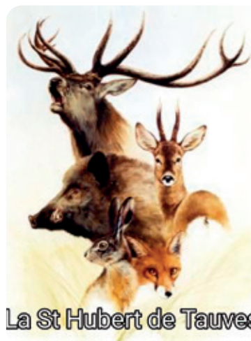
La St Hubert de Tauves

Pour cette nouvelle année, la société de chasse de Tauves propose une grande diversité d'animaux.