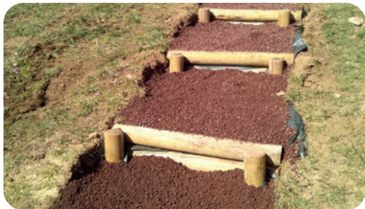
Escalier vers La Bascule