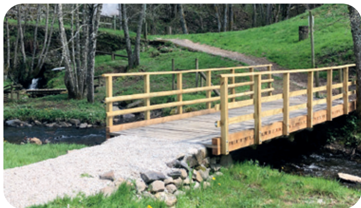
La passerelle Saint Gal