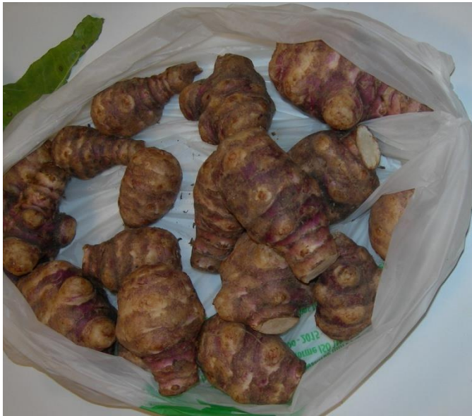
DES TOPINAMBOURS (comme des pommes de terre)