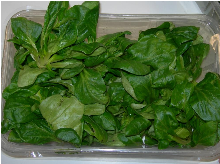
DE LA MÂCHE : salade qui pousse en hiver