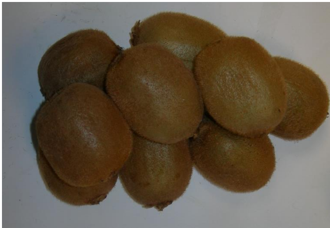
DES KIWIS verts avec plein des petits grains noirs dedans