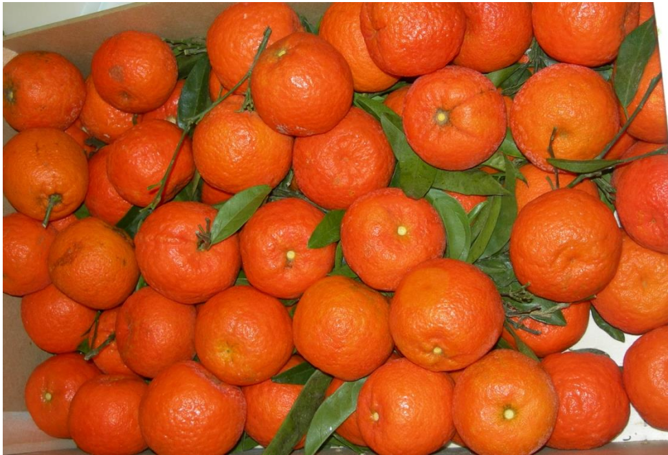
DES CLEMENTINES de la famille des oranges