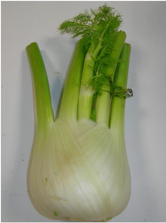
DU FENOUIL avec le goût d'anis, cru ou cuit