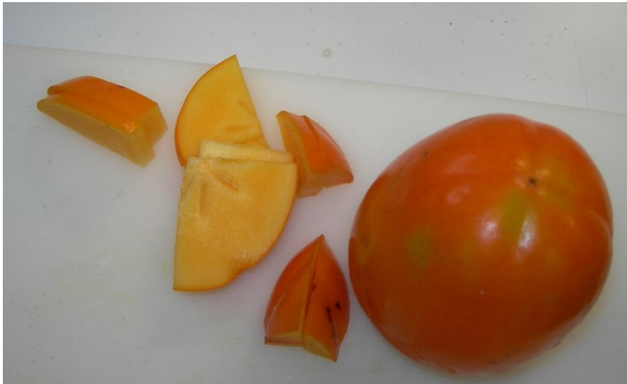
UN KAKI de couleur orange sur la peau et jaune dedans