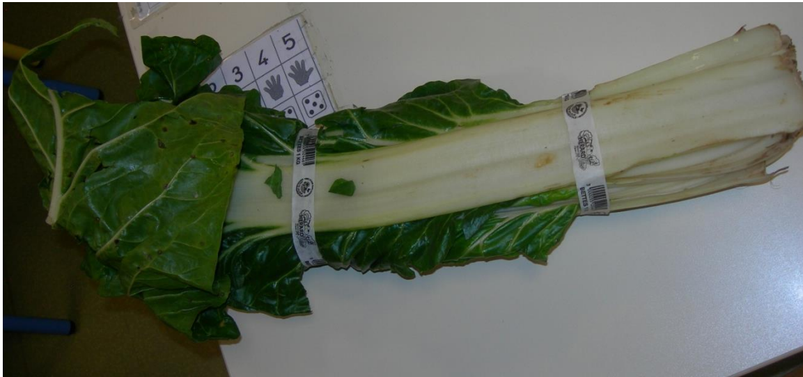
DES CARDES qui se mangent avec de la sauce blanche