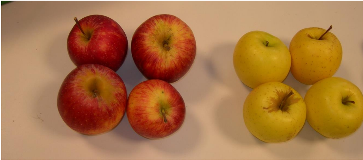
DES POMMES rouges ou jaunes