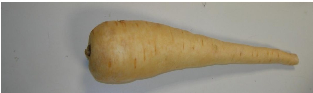
UN PANAIS de la famille des carottes et des radis